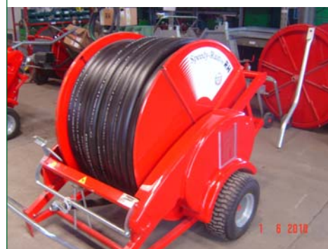
Hose reel machine for small fields