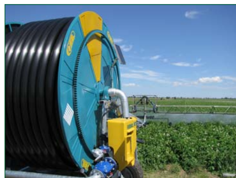
Hose reel machine using spray boom

Cette nouvelle version de la machine est bien connue en Europe et dans d'autres régions du monde.