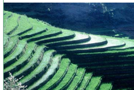
Rice terraces in hilly and/or mountainous areas

de politiques générales et spécifiques sur le développement des ressources en eau et terres. Ces activités comportent entre autre les mesures de conservation d'eau pouvant changer l'attitude et les habitudes de la communauté à tout niveau, y compris le personnel du Gouvernement, pour pouvoir utiliser l'eau de manière plus efficace. Ces politiques concernent également la reprise des activités de reboisement et des cultures dans les bassins versants supérieurs, les mesures de conservation du sol dans les régions en pente, l'amélioration des pratiques d'exploitation et de maintenance de toutes les infrastructures d'irrigation pour rendement optimal, l'utilisation plus efficace de l'eau d'irrigation par l'adoption des meilleures techniques telles que les méthodes d'aspersion et de goutte à goutte, et l'irrigation intermittente plutôt que submersion continue du riz paddy.