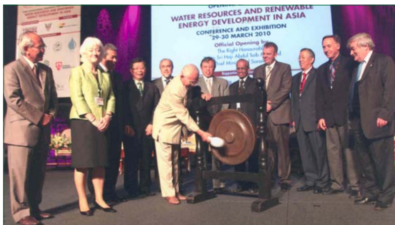
ASIE 2010 was inaugurated by Rt. Hon. Pehin Seri Haji Abdul Taib Mahmud, Chief Minister of Sarawak in the presence of other dignitaries from international organizations

Dans le passé, nous avons accordé plus d'attention aux lignes de conduite de