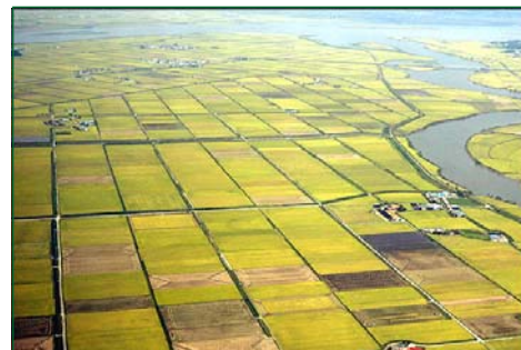
Irrigated paddy fields in the low-lying plain areas

En Indonésie, malgré l'abondance des ressources en eau et terres, celles-ci ne sont pas encore totalement exploitées. Le Gouvernement indonésien a lancé une série