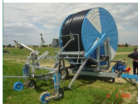
Hose reel machine using rain gun