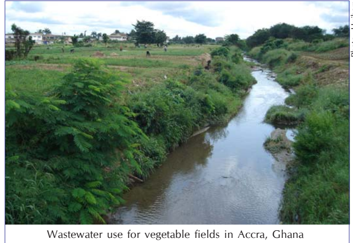
Wastewater use for vegetable fields in Accra, Ghana

Les eaux perdues signifient les choses différentes au peuple différent car il existe un grand nombre de définitions. Cependant, il peut être défini comme "une combinaison d'un ou plus de : effluent domestique comportant l'eau noire (excrétions) et l'eau grise (cuisine et eaux usées de bain); eau des installations commerciales et institutions, y compris les hôpitaux; effluent industriel, eaux pluviales et d'autre écoulements urbains; effluent agricole, horticole et d'aquaculture, dissous ou comme matière suspendue.