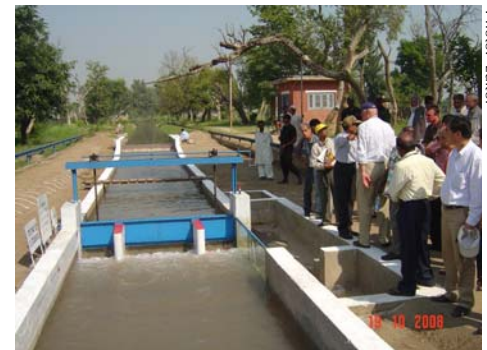
Visite des délégués à la Station de Recherche Hydraulique de Nandipur située à 80 kms de Lahore. Station établie en 1952 qui a mené des études sur nombreux essais des modèles hydrauliques.